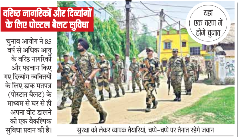
सुरक्षा को लेकर व्यापक तैयारियां, चपे-चपे पर तैनात रहेंगे जवान

वरिष्ठ नागरिकों और दिव्यांगों के लिए पोस्टल बैलट सुविधा यहां एक चरण में होगा चुनाव चुनाव आयोग ने 85 वर्ष से अधिक आयु के वरिष्ठ नागरिकों और पहचान किए गए दिव्यांग व्यक्तियों के लिए डाक मतपत्र (पोस्टल बैलट) के माध्यम से घर से ही अपना वोट डालने की एक वैकल्पिक सुविधा प्रदान की है।