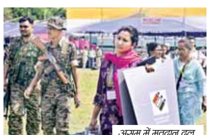
असम में मतदान दल

असम, केरल और केंद्र शासित प्रदेश पुडुचेरी में विधानसभा चुनाव के लिए प्रचार का शोर अब पूर्ण रूप से थम चुका है। गुरुवार को इन तीनों क्षेत्रों की कुल 296 सीटों पर एक ही चरण में मतदान होने हैं। इसके साथ ही उम्मीदवारों की किस्मत ईवीएम में कैद हो जाएगी। चुनाव आयोग के अनुसार, असम की 126, केरल की 140 और पुडुचेरी की 30 सीटों पर वोटिंग कराई जाएगी। असम की बात करें तो यहां कुल 2.5 करोड़ मतदाता हैं, जिनमें 1.25 करोड़ पुरुष, 1.25 करोड़ महिलाएं और 343 थर्ड जेंडर मतदाता शामिल हैं। खास बात यह है कि 18-19 वर्ष आयु वर्ग के