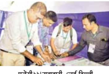
एजेसी नई दिल्ली

असम, केरल और केंद्र शासित प्रदेश पुदुचेरी में विधानसभा चुनाव के लिए गुरुवार को एक ही चरण में मतदान कराया जाएगा। चुनाव आयोग और स्थानीय प्रशासन ने शांतिपूर्ण, निष्पक्ष और पारदर्शी मतदान सुनिश्चित करने के लिए व्यापक तैयारियां पूरी कर ली हैं। असम विधानसभा चुनाव को लेकर सुरक्षा व्यवस्था कड़ी कर दी गई है। चिरांग जिले में शांतिपूर्ण और सुनिश्चित ढंग से मतदान करने के लिए सुरक्षा व्यवस्था को लेकर व्यापक तैयारियां की गई हैं। केंद्रीय औद्योगिक सुरक्षा बल को इकाई, तेल निगम के बॉगाईगांव केंद्र, केंद्रीय रिजर्व पुलिस बल, जिला प्रशासन और राज्य पुलिस के वरिष्ठ अधिकारियों ने मिलकर तय किए गए कक्ष के स्थान का निरीक्षण किया। इस दौरान व्यवस्था और आवश्यक सुरक्षा ढांचे का गहन समीक्षा की गई अधिकारियों ने निरीक्षण के दौरान यह सुनिश्चित करने पर जोर दिया कि मजबूत कक्ष के आसपास सुरक्षा के सभी जरूरी प्रबंध समय से पहले पूरे कर लिए जाएं। अधिकारियों का कहना है कि चुनाव के दौरान मतपेटियों और संबंधित सामग्रियों की सुरक्षा सर्वोच्च प्राथमिकता होती है। किसी भी तरह की लापरवाही को कोई गुंजाइश नहीं रहेगी।