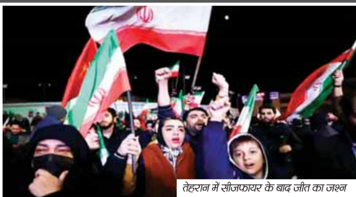
तेहरान में सीजफायर के बाद जीत का जश्न

डोनाल्ड ट्रंप की 5 वीं धमकी के बाद ईरान से जंग 2 हफ्तों के लिए रुक गई। दोनों देश 2 हफ्तों के सीजफायर के लिए राजी हो गए हैं। ट्रंप ने यह युद्ध-विराम अपने सोशल मीडिया प्लेटफॉर्म ट्यू सोशल पर घोषित किया। उन्होंने कहा कि पाकिस्तान की तरफ से दिया गया प्रस्ताव स्वीकार कर लिया है। इस प्रस्ताव में कहा गया है कि दो हफते तक लड़ाई रोक दी जाए और होर्मुज जलडमरूमध्य को तुरंत खोल दिया जाए। ट्रंप ने कहा कि अमेरिका इन दो हफ्तों के समय का इस्तेमाल ईरान के साथ अंतिम समझौता करने के लिए करेगा। उन्होंने लिखा कि ऐसा करने का कारण यह है कि हम अपने सभी सैन्य लक्ष्यों को पहले ही पूरा कर चुके हैं और उनसे भी आगे बढ़ चुके हैं। साथ ही हम ईरान के साथ लंबे समय की शांति और पूरे मध्य पूर्व में शांति के लिए एक पक्का समझौता करने के बहुत करीब हैं।