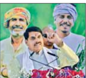
हरिभूमि न्यूज | जबलपुर

सीएम ने कहा कि जय किसान, जय जवान में जय विज्ञान जोड़ा गया था। वर्तमान दौर में हम इसमें जय अनुसंधान भी जोड़ रहे