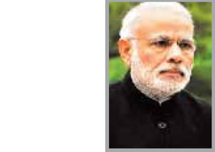
(लेखक स्वतंत्र पत्रकार हैं, ये उनके अपने विचार हैं।)