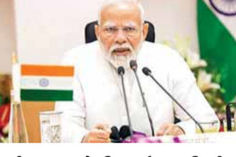
खरीफ 2026 के लिए उर्वरक सब्सिडी को दी मंजूरी

केंद्रीय मंत्रिमंडल ने खरीफ सीजन 2026 के लिए फॉस्फेटिक और पोटाशिक उर्वरकों पर न्यूट्रिएंट बेस्ड सब्सिडीदरों को मंजूरी दे दी है। खरीफ के लिए अनुमानित बजटीय आवश्यकता लगभग 41,533.81 करोड़ होगी। यह पिछले बजट के मुकाबले करीब 4,317 करोड़ रुपए अधिक है। इससे किसानों को सब्सिडी के तहत