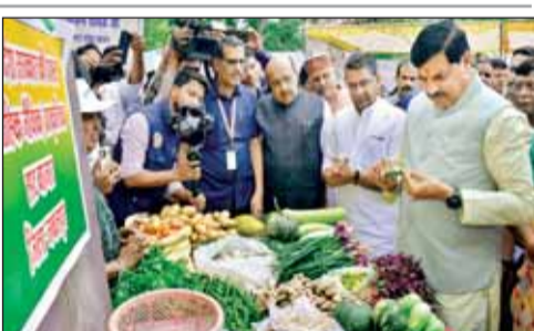
प्रदर्शनी का अवलोकन करते सीएम

उन्होंने कहा कि नर्मदा घाटी परियोजनाओं और सिंचाई विस्तार से प्रदेश की कृषि उत्पादन क्षमता में उल्लेखनीय वृद्धि हुई है। इस अवसर पर उन्होंने उन्नत बीज प्रसंस्करण,