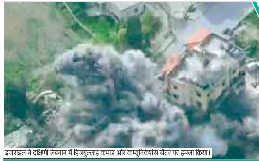
इजराइल ने दक्षिणी लेबनान में हिजबुल्लाह कमांड और कम्युनिकेशन सेंटर पर हमला किया।