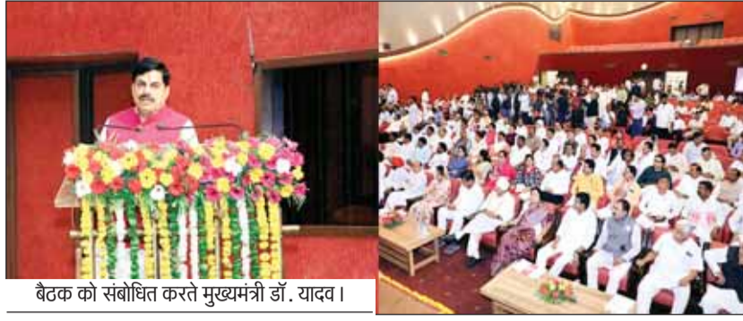
बैठक को संबोधित करते मुख्यमंत्री डॉ. यादव।