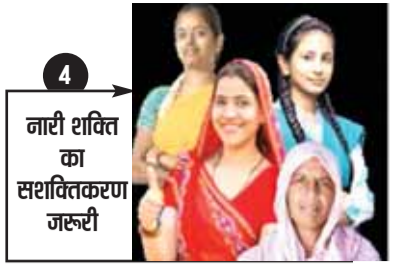
नारी शक्ति का सशक्तिकरण जरूरी

जबलपुर मैट्रो नर्सिंग ऑफिसर भर्ती में 100% महिला..