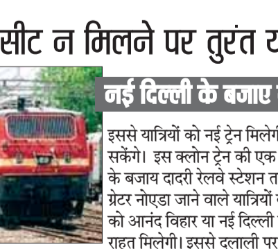
नई दिल्ली के बजाय दादरी रेलवे स्टेशन तक

एजेसी नई दिल्ली उत्तर मध्य रेलवे ने दिल्ली जाने वाले यात्रियों की भारी भीड़ और लंबी वेटिंग लिस्ट को देखते हुए 'क्लोन स्पेशल' ट्रेन चलाने का अहम निर्णय लिया है। प्रयागराज एक्सप्रेस और हमसफर जैसी ट्रेनों में सीट न मिलने पर तुरंत यह विशेष ट्रेन चलाई जाएगी, जिससे नोएडा और ग्रेटर नोएडा जाने वाले यात्रियों को आसानी से कंफर्म टिकट मिल सके। यह ट्रेन नई दिल्ली के बजाय दादरी स्टेशन तक जाएगी, जिससे नोएडा और ग्रेटर नोएडा जाने वाले लोगों को ट्रेफिक से राहत मिलेगी। यह ट्रेन प्रयागराज से चलकर कानपुर और अलीगढ़ जैसे प्रमुख स्टेशनों पर भी रुकेगी।